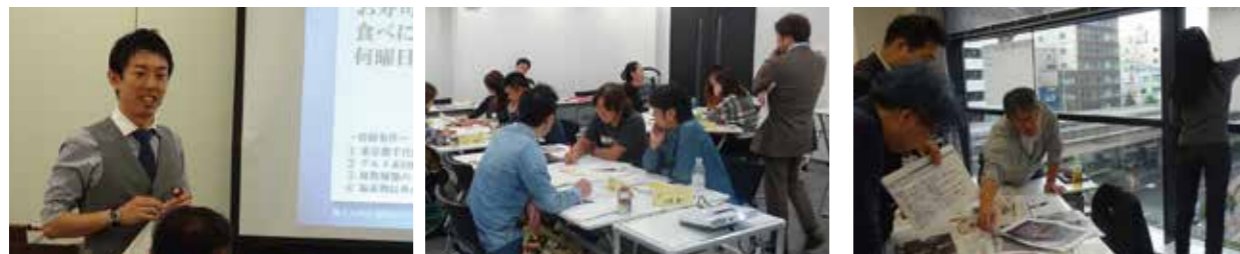
カフェ、居酒屋、洋菓子店、エステサロン等、様々な業種の方が受講されています。

対象者 都内に店舗を持つ小売店・飲食店・サービス業の経営者・後継者・従業員等 定員 60名(各コース20名、定員を超えた場合は抽選)